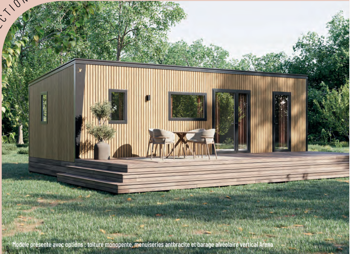
Modèle présenté avec options : toiture monopente, menuiseries anthracite et barage alvéolaire vertical Arena