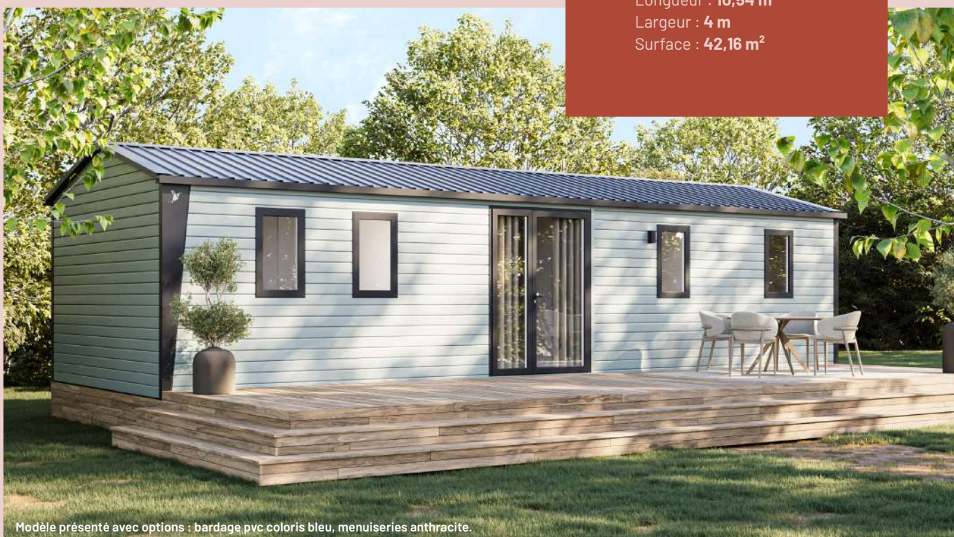
Modèle présenté avec options : bardage pvc coloris bleu, menuiseries anthracite.

Longueur : 10,54 m Largeur : 4 m Surface : 42,16 m 2